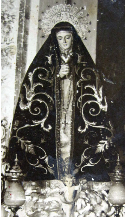
Imatge de la Verge de la Soledat d'Ondara, fotografia anterior a 1936.

La imatge de la Mare de Déu de la Soledat està lligada a Ondara des de fa segles. Durant tots aquests anys, molts són els episodis que han anat escrivint-se en la seva particular història. Intentarem conèixer algunes pinzellades amb aquestes línies.