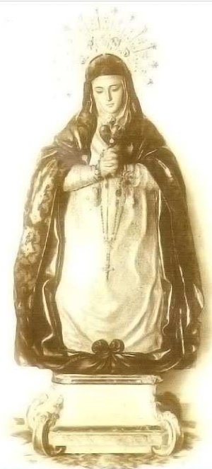
Verge de la Soledat d'Ondara Fotografia anterior a 1936